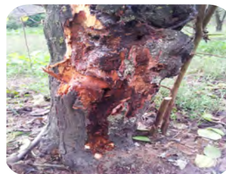
Cerambycide delle drupacee ( Aromia bungii ): bello...ma può causare la morte dei nostri alberi da frutto.