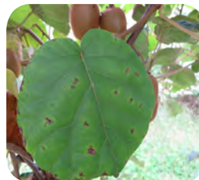
Cancro batterico del kiwi ( Pseudomonas syringae pv. actinidiae ): invisibile ... ma può distruggere i nostri impianti di kiwi.