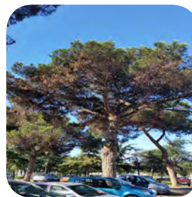
Cocciniglia tartaruga ( Toumeyella parvicornis ): dalle Americhe...una grande minaccia alle nostre pinete.