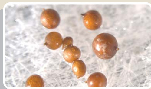
Cisti al microscopio