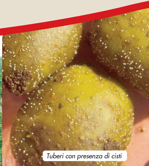
Tuberi con presenza di cisti