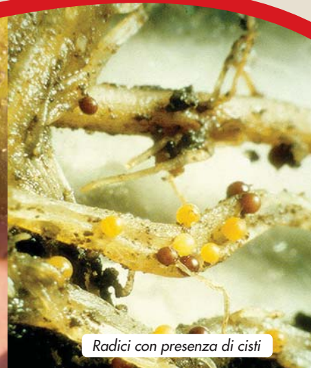
Radici con presenza di cisti