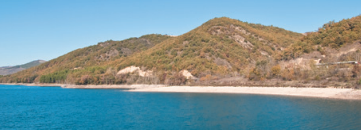
Veduta del Lago San Pietro - Aquilonia (AV)

Un viaggio tra spiritualità ed ascetismo, visitando musei e borghi, affascinati da storie di letterati, antichi culti pagani, laghi, paesaggi, mani esperte che lavorano: intrecci emozionali di una terra vera, viva. Un viaggio che si fa in silenzio nei Musei: a Bisaccia, sulle orme degli Irpini, a Calitri, terra di ceramiche, ad Aquilonia aper vivere e respirare la vita della civiltà contadina. Il silenzio che si ritrova tra le pietre preistoriche di Carbonara o nell'Abbazia del Goletto, tra castelli medioevali e nella Valle d'Ansanto alla scoperta della dea Mefite,