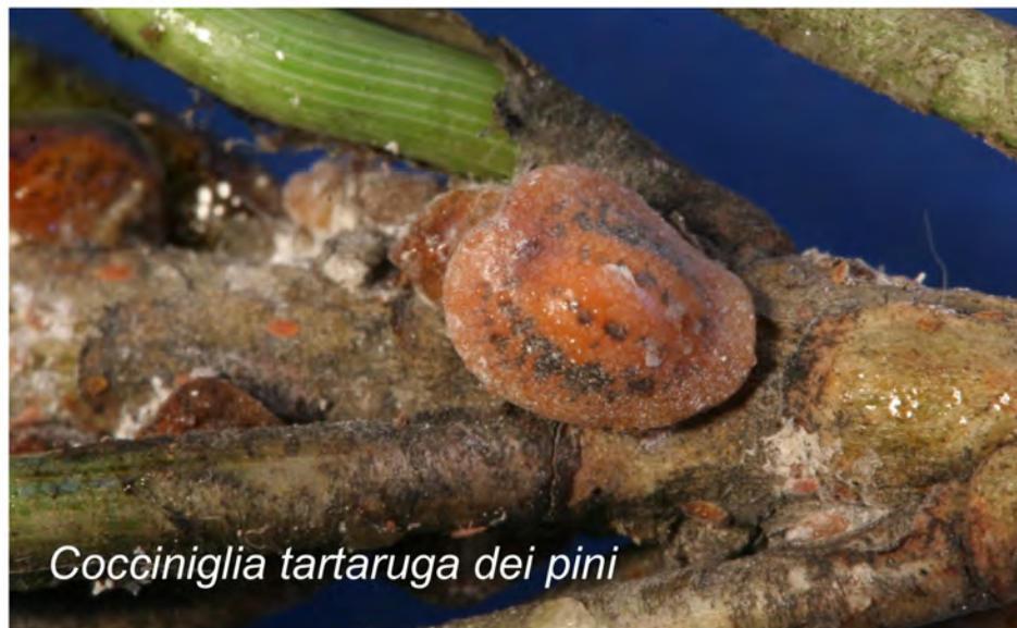
Cocciniglia tartaruga dei pini