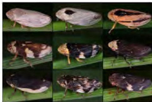
Variabilità cromatica degli adulti